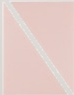
WEDGE MAKE UP SPONGE 2pcs No 202