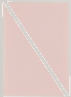
WEDGE MAKE UP SPONGE 2pcs No 201