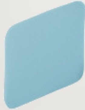
MAKE UP SPONGE 1 pc No 101