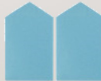
WEDGE MAKE UP SPONGE 2pcs No 301