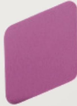
MAKE UP SPONGE 1 pc No 102